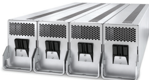
Módulo de bateria