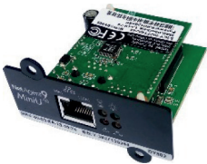
Placa de monitoração