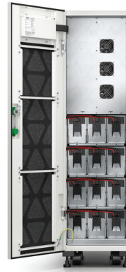
Nobreak Easy UPS 3S de 10 kVA com baterias internas