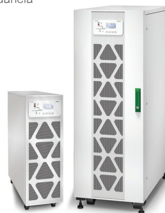
Nobreak Easy UPS 3S de 40 kVA com baterias externas